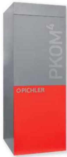
unità di ventilazione