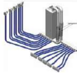
sistema di ventilazione